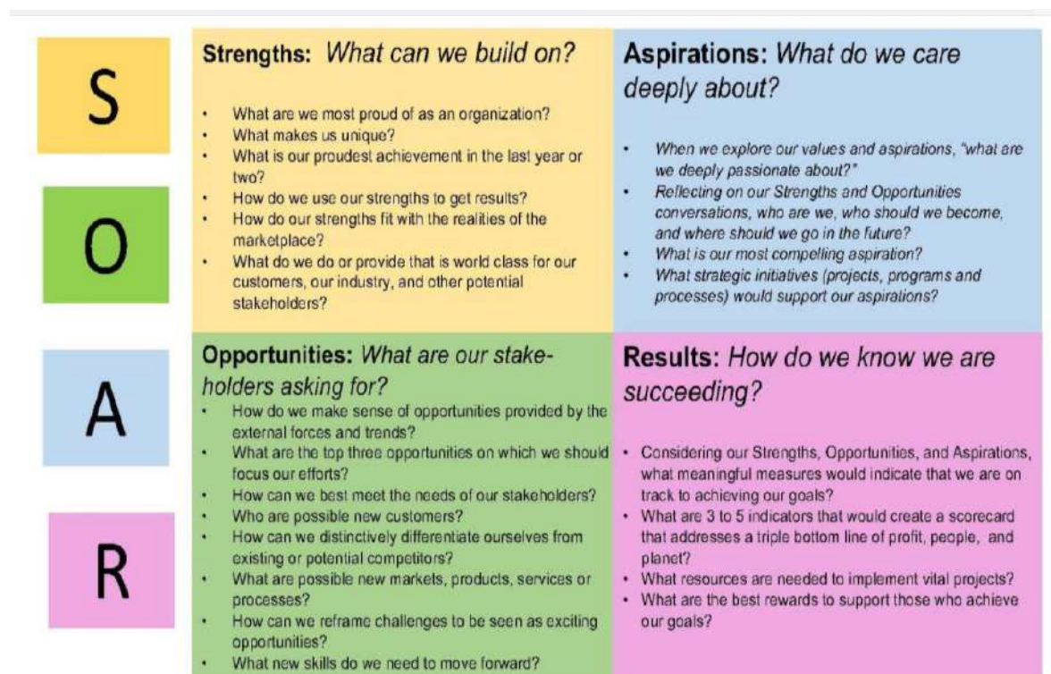
Gambar 3. Pertanyaan Inti dalam Menyusun Model SOAR (Stavros & Hinrichs, 2009)

Berikut ini adalah pertanyaan-pertanyaan yang diajukan kepada responden maupun stakeholder dalam organisasi untuk menyusun strategi pengembangan destinasi atau menyusun strategi perusahaan yang berfokus pada hasil.