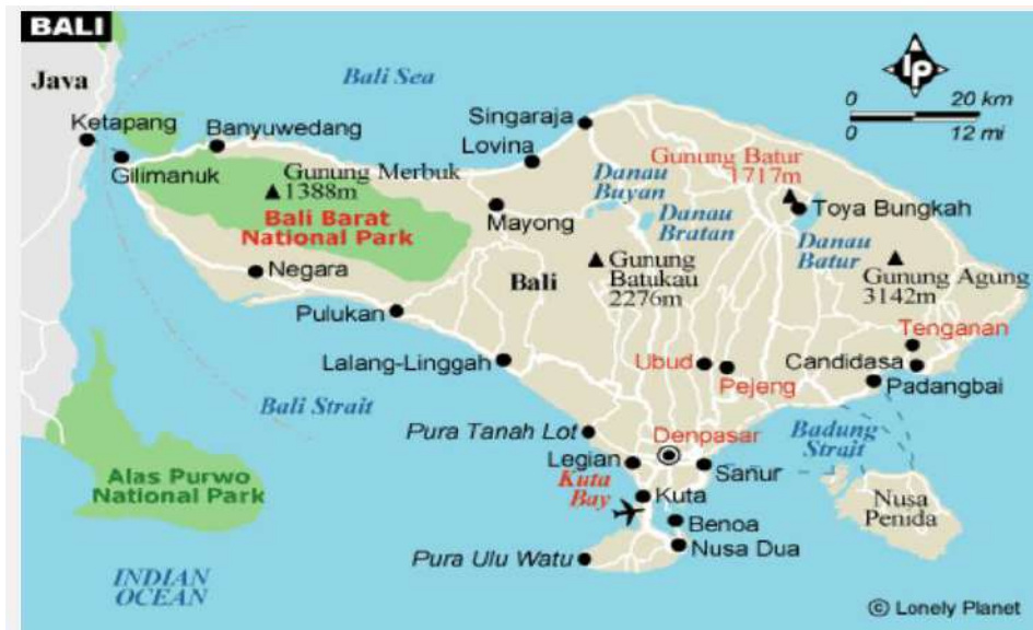
Gambar 4. Letak Kota Singaraja Di Pulau Bali

Penelitian ini mengambil lokasi di Kota Singaraja dengan mengambil semua lokasi yang memiliki daya tarik wisata, seperti Eks Pelabuhan Buleleng, Puri Buleleng, Pantai Penimbangan, Pasar Banyuasri, Tugu Tiga, Taman Sukarno, dan lain-lain. Kota Singaraja merupakan ibukota Kabupaten Buleleng yang terletak di ujung utara pulau Bali. Kota Singaraja dapat di jangkau dalam waktu kurang lebih 2 jam dari Kota Denpasar atau sekitar 3 jam dari Airport Ngurah Rai. Lokasi Kota Singaraja dalam peta Bali dapat dilihat seperti di Gambar 4. Penelitian dilaksanakan bulan April 2021 sampai dengan Juni 2021.