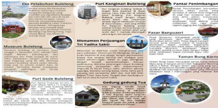
Gambar 5. Photo Desain Brosur Atraksi Wisata